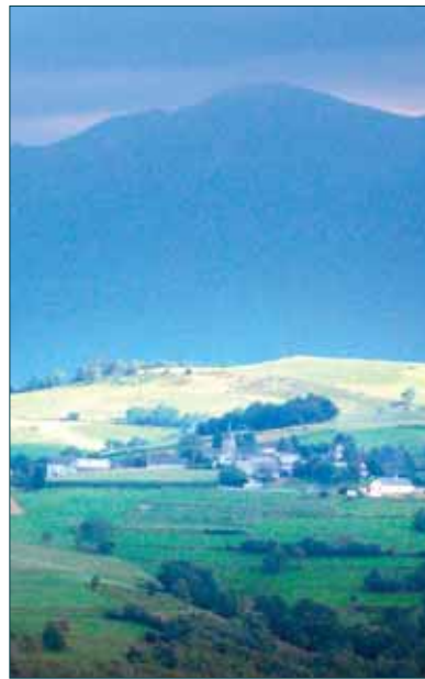
TERRITOIRES TERROIRS TERREAU